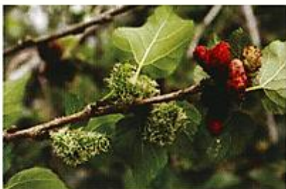
ช่อดอกและผลสุก