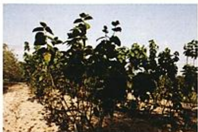
ต้นหม่อน