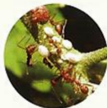
เพลี้ยหอย