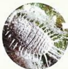
เพลี้ยแป้ง