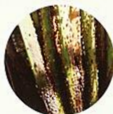
เพลี้ยไฟ